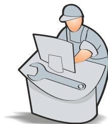
IT-Services nach ITIL V3

Die technischen und organisatorischen Maßnahmen sowie das Datenschutzhandbuch werden kontinuierlich an die Anforderungen des Datenschutzes angepasst. Die externe Datenschutzbeauftragte steht Netzlink-Kunden jederzeit gern für Fragen zur Verfügung. Das Datenschutzkonzept kann auf Nachfrage eingesehen werden.